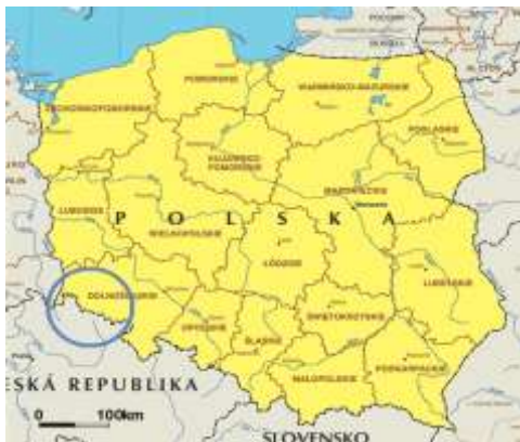
Figuur 2.1: Neder Silezië

Neder Silezië heeft bij verscheidene landen gehoord en maakt vanaf 1945 onderdeel uit van Polen. Vanaf de middeleeuwen heeft het bij Polen, Bohemen, Oostenrijk, Pruisen en Duitsland gehoord.