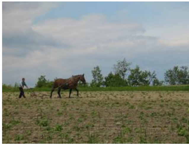
Figuur 1: Ploegende boer bij Jelenia Góra, Hirschberg in Polen.

Een verkenning en conceptualisatie van ontstaan en huidig functioneren van rurale, kleinschalige economieën in de gemeente Stara Kamienica, Silezië