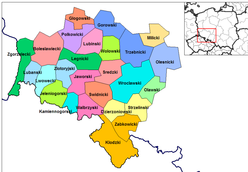
Figuur 3: De provincie Silezië en de indeling in administratieve Powiats.

Voor 1999 kende Polen 49 provincies die een grote administratieve lastendruk teweegbracht. Dit was aanleiding voor de administratieve herindeling. Op 1 januari 1999 voltrok zich een administratieve herindeling in Powiats die de onderstaande geografische indeling tot gevolg had. Vanuit het oogpunt van toetreding tot de EU heeft de EU aangedrongen op het bereiden van provincies of graafschappen van gelijke grootte, zowel in Tsjechië als in Polen. De Euregio Neisse bestond al vóór 1999, maar breidde zich zo in het Pools – Duits – Tsjechische grensgebied uit met administratieve eenheden van gelijke grootte. Dat vergemakkelijkte de positie van de EU bij het contactleggen voor onderhandelingen in grensoverschrijdende vraagstukken ( http://area.geog.uu.nl/euregionaisse/administratie.htm , laatst bezocht op 18-3).